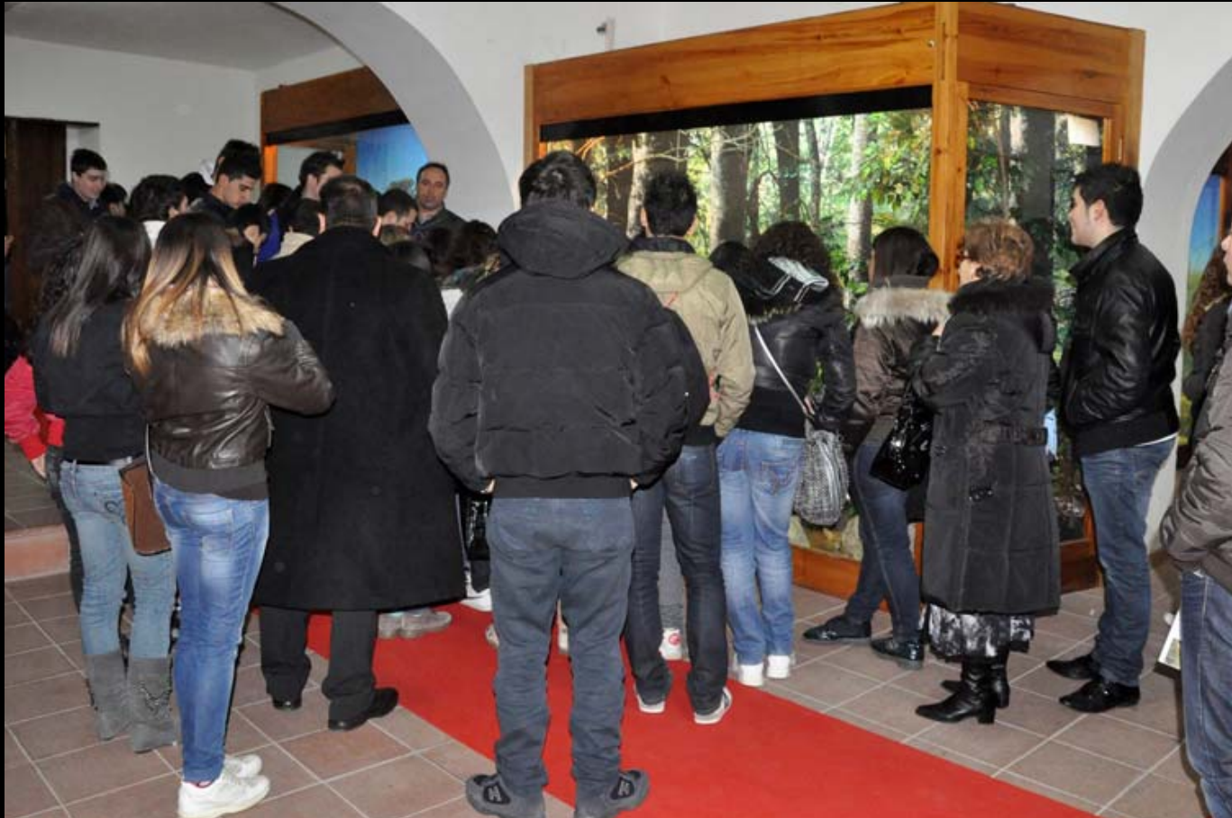
Museo di Storia Naturale della Calabria Sezione Diorami Aree Protette della Calabria