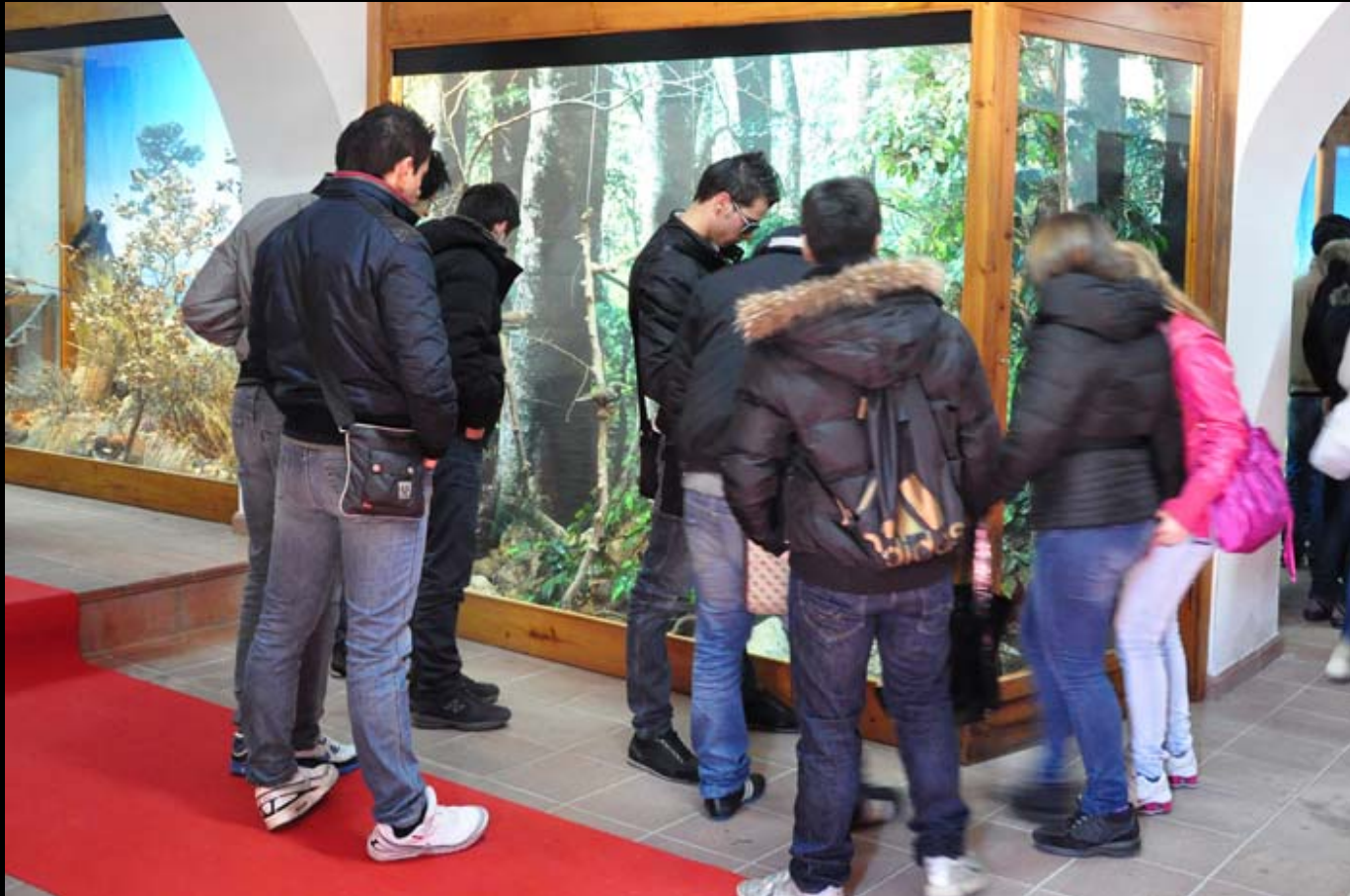
Museo di Storia Naturale della Calabria Sezione Diorami Aree Protette della Calabria