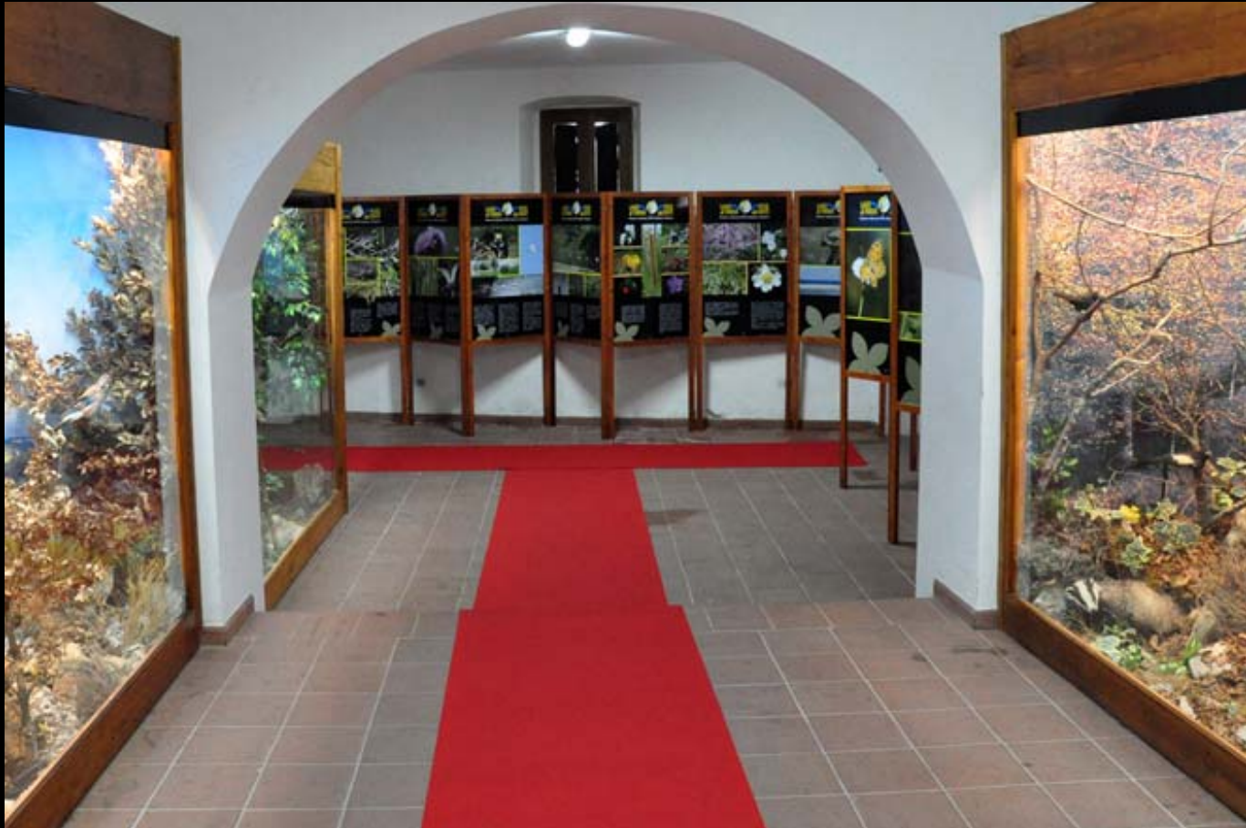
Museo di Storia Naturale della Calabria Sezione Diorami Aree Protette della Calabria