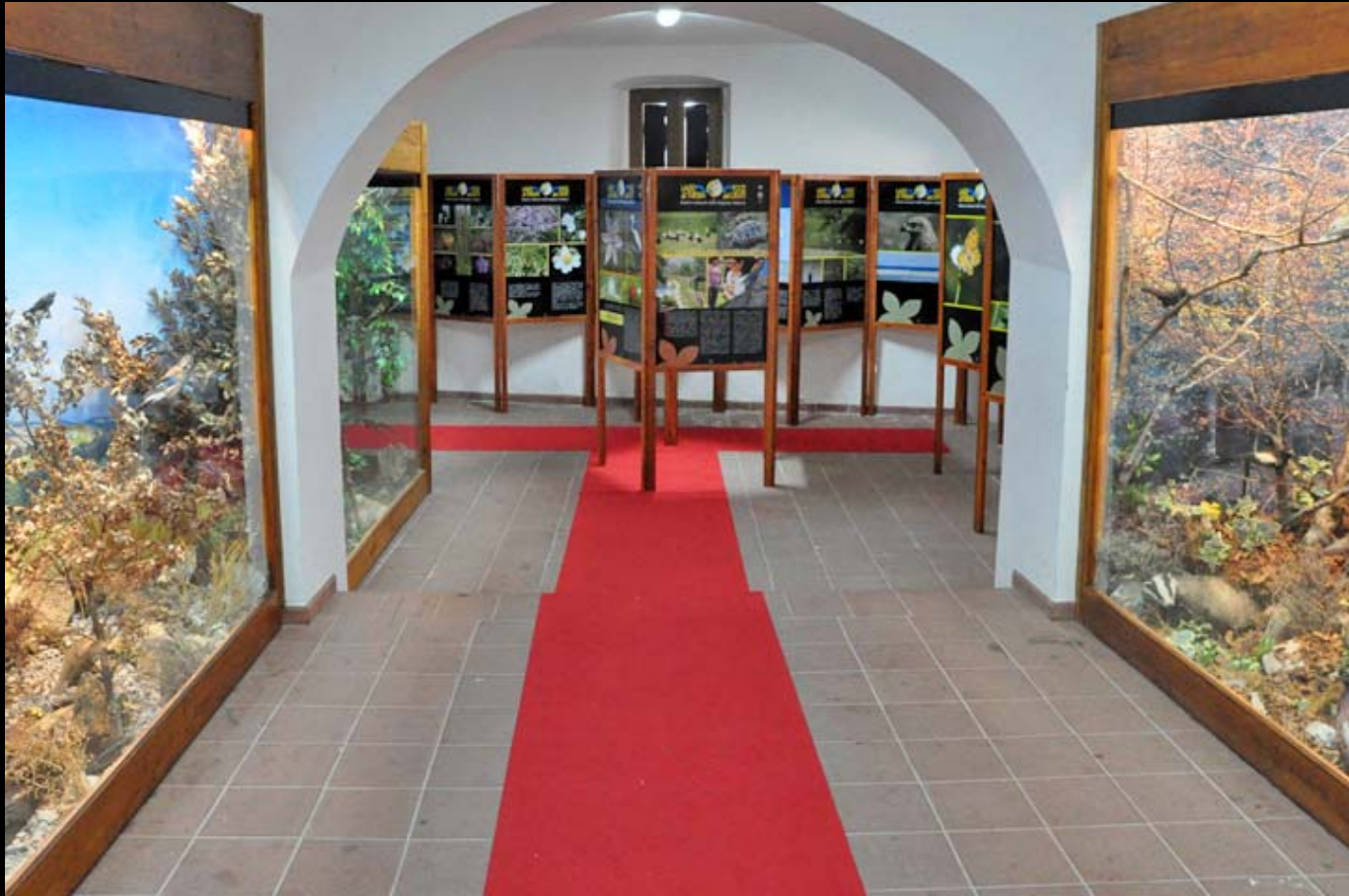
Museo di Storia Naturale della Calabria Sezione Diorami Aree Protette della Calabria