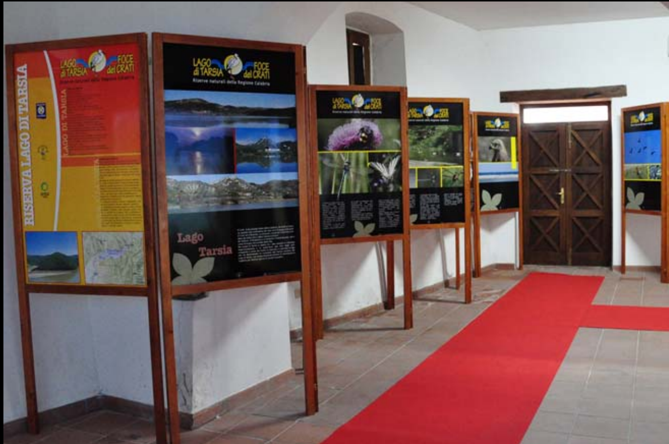
Museo di Storia Naturale della Calabria Sezione Diorami Aree Protette della Calabria