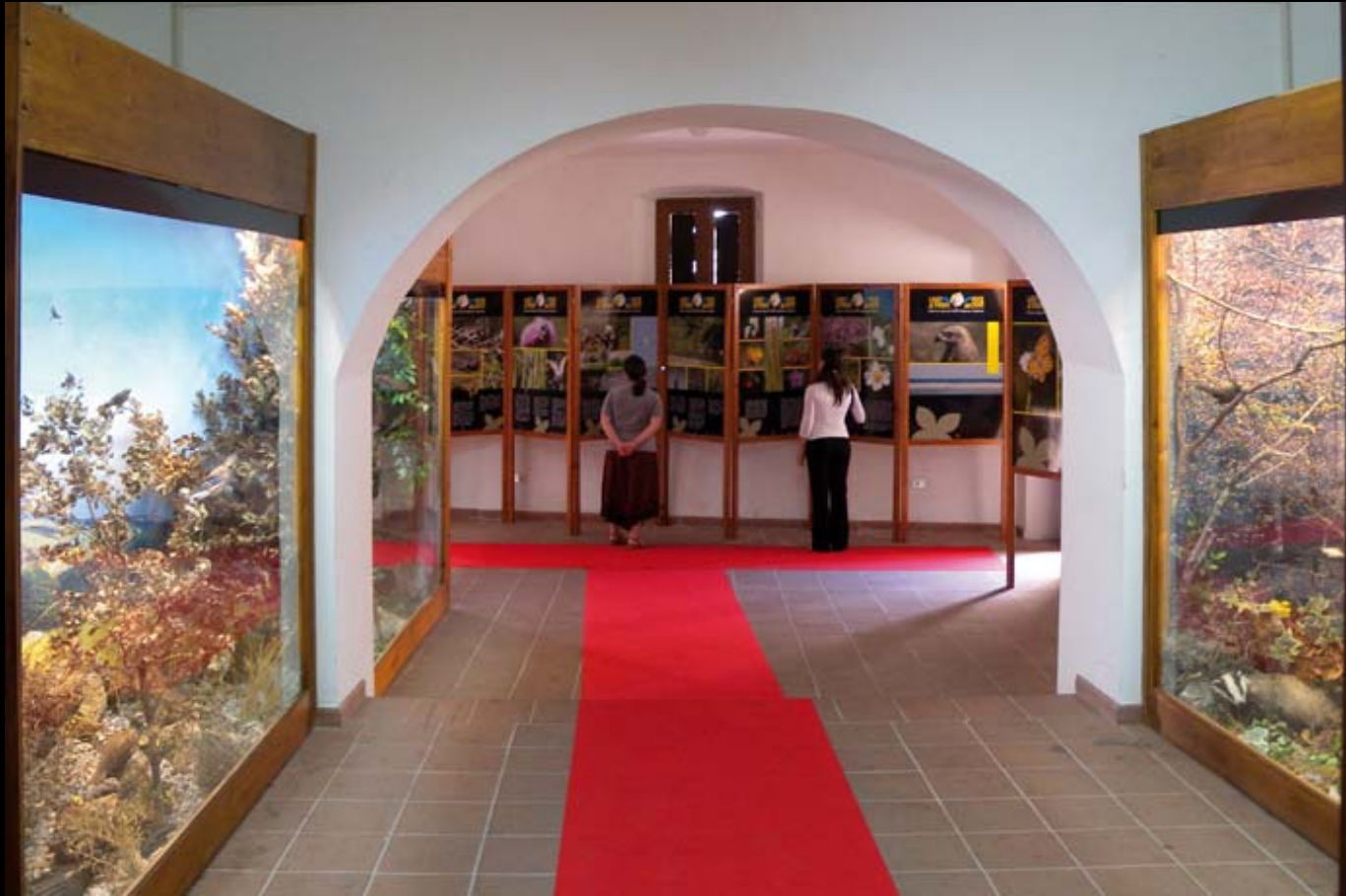
Museo di Storia Naturale della Calabria Sezione Diorami Aree Protette della Calabria