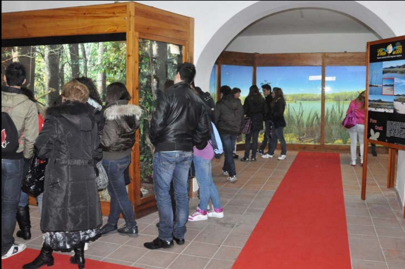
Museo di Storia Naturale della Calabria Sezione Diorami Aree Protette della Calabria