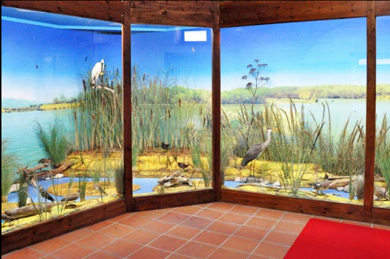
Museo di Storia Naturale della Calabria Sezione Diorami Aree Protette della Calabria