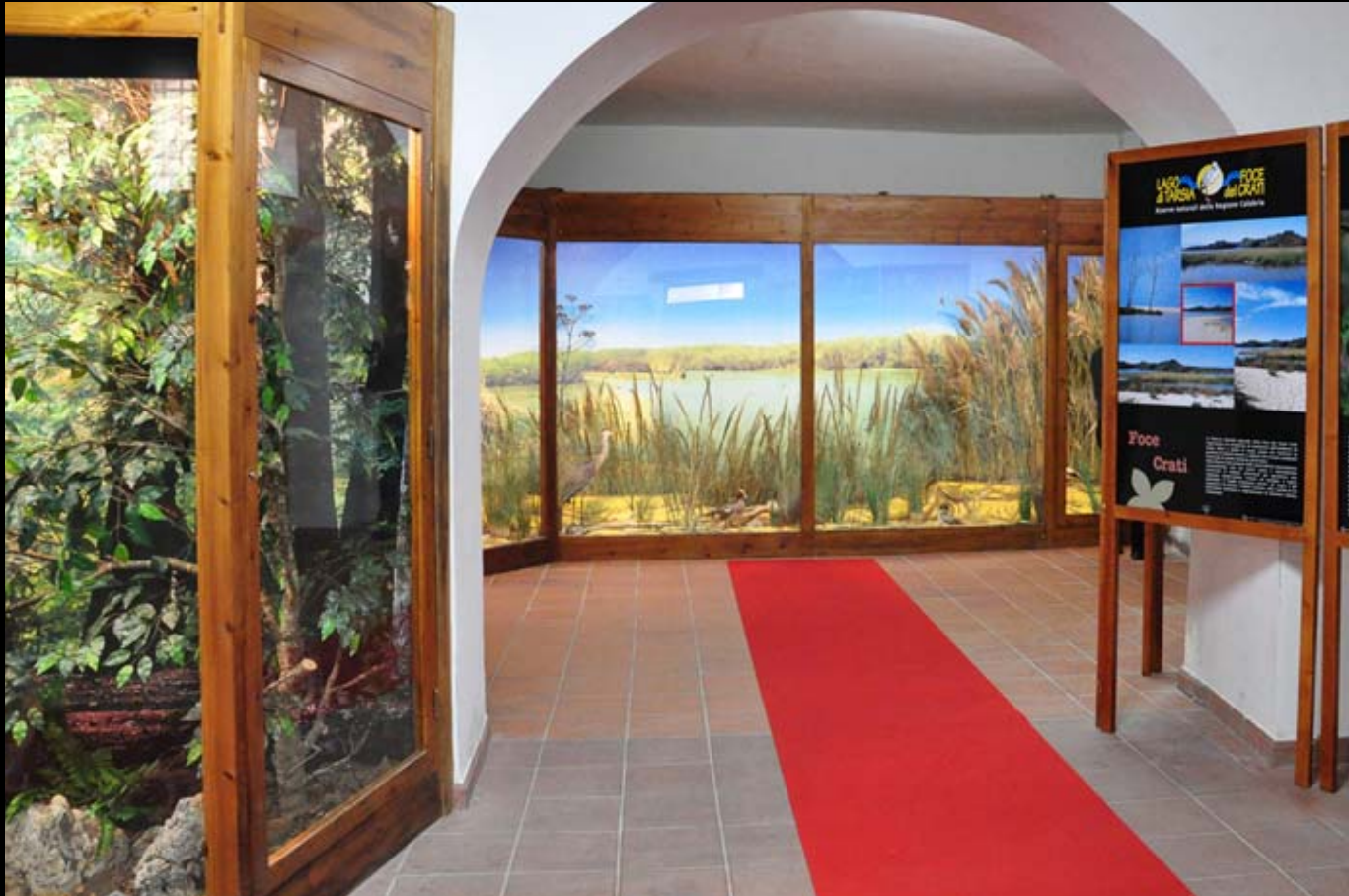
Museo di Storia Naturale della Calabria Sezione Diorami Aree Protette della Calabria